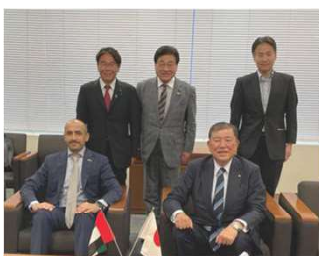
日本・UAE友好議員連盟でUAE大使閣下を招いて