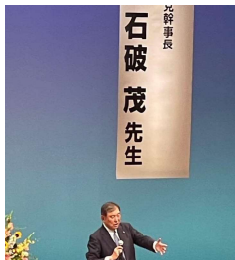
総裁選告示前日9月11日に石破茂時局講演会を行いました