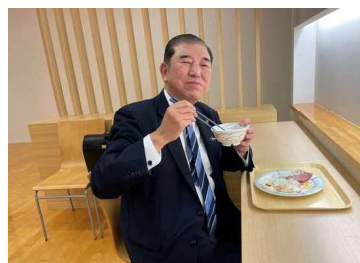
議員宿舎の食堂で朝食がいつも一緒でした