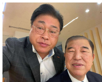
議員宿舎の食堂で記念撮影です

石破茂内閣総理大臣との太いパイプを活かして、会津、県南地域の課題解決に向けて全力で取り組んで参ります!!