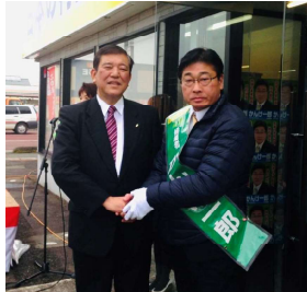
選挙応援で固い握手