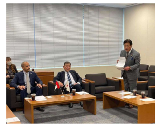
石破会長、私が事務局長を務める日本・UAE友好議員連盟にて会議