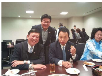
石破先生と日頃の懇談