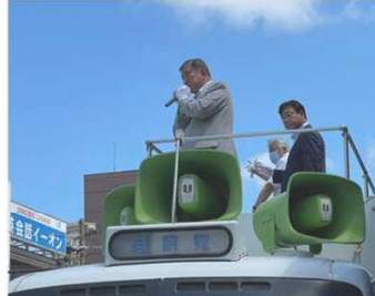
何度も選挙応援に駆け付けて頂きました!!