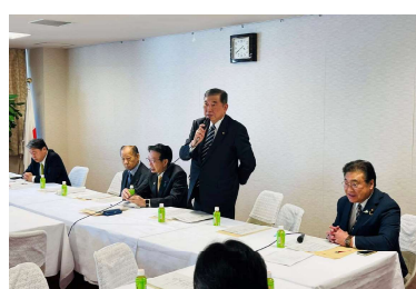
ジビエ石破会長と私が事務局長を務める鳥獣被害対策特別委員会の会議