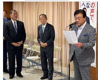
自民党本部でジビエの試食会